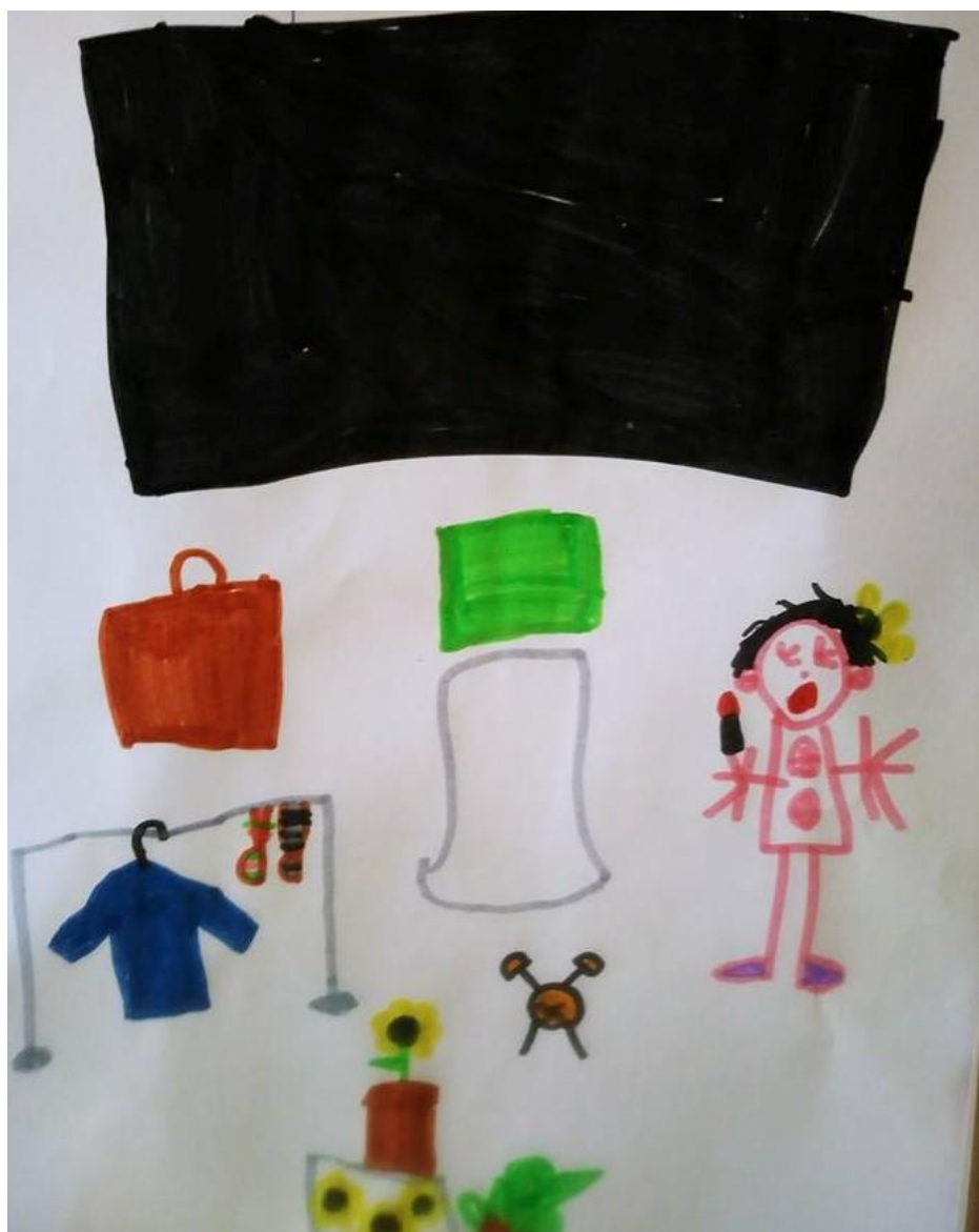
Dessin d'enfant après une représentation en école maternelle, Bruxelles